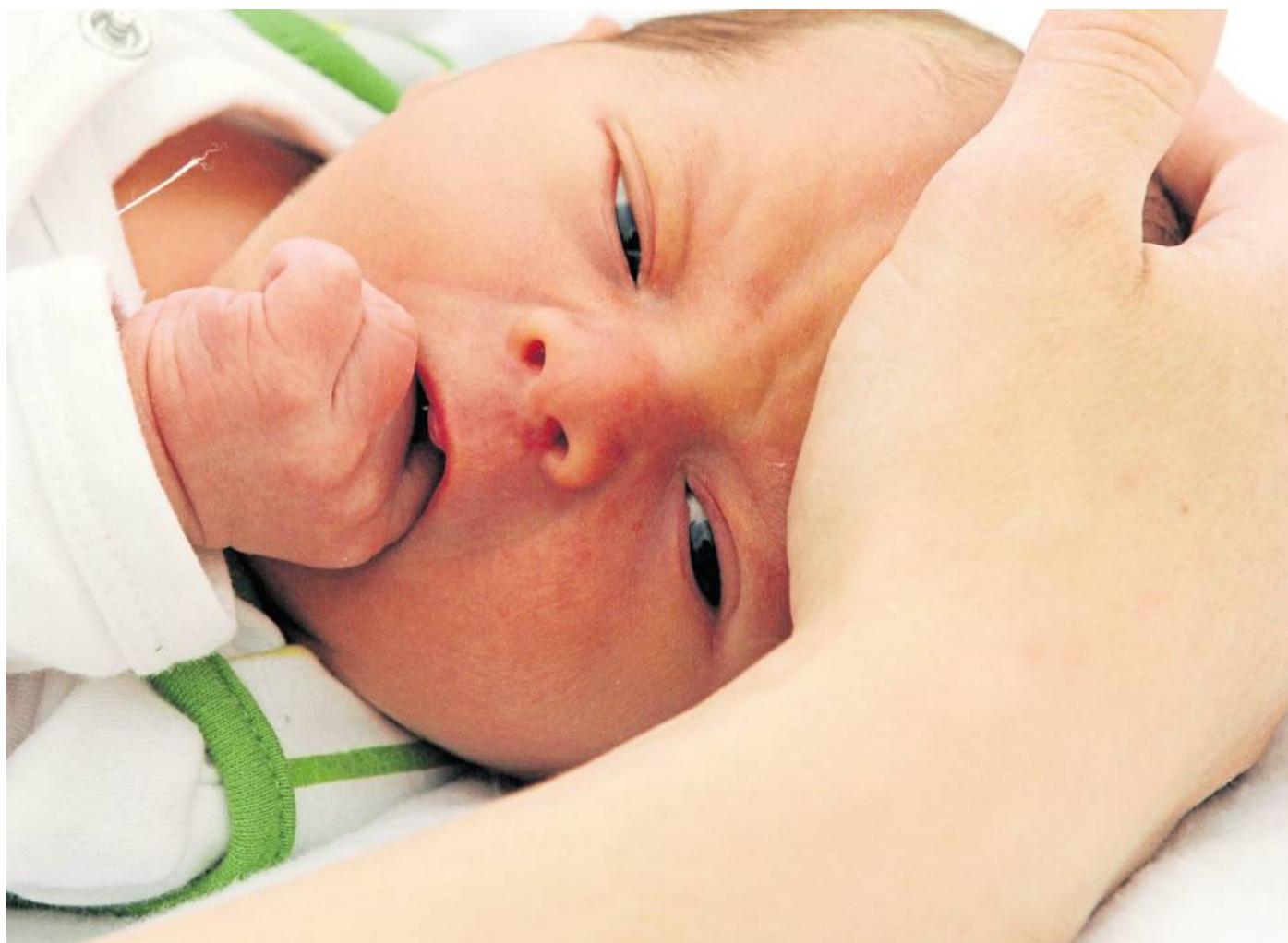
Wenn ein Baby geboren wird, gibt es viele Fragen. Die Hebammen-Sprechstunde im Familienzentrum Sternschnuppe hilft werdenden und jungen Müttern.

• AWO Kur und Erholung , 9.30 Uhr bis 12 Uhr, 13 Uhr bis 15 Uhr, AWO Stadtbüro Herten, Tel. 02366/180815, Antoniusstr. 29 • Beratungs- und Infocenter Pflege , 8 Uhr bis 17.30 Uhr, Rathaus, Zimmer 001, Tel. 02366/303586 oder 303270, Kurt-Schumacher-Str. 2 • Deutsches Rotes Kreuz , 7 Uhr bis 18 Uhr, Tel. 02366/18150, Gartenstr. 56 • Sozialpsychiatrische Beratungsstelle , 8.30 Uhr bis 10 Uhr, Tel. 02366/1056-8010 oder 8011, Gesundheitsamt, Kurt-Schumacher-Str. 28